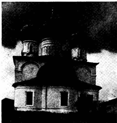
118. Преображенский собор. 1668—1670-е гг.