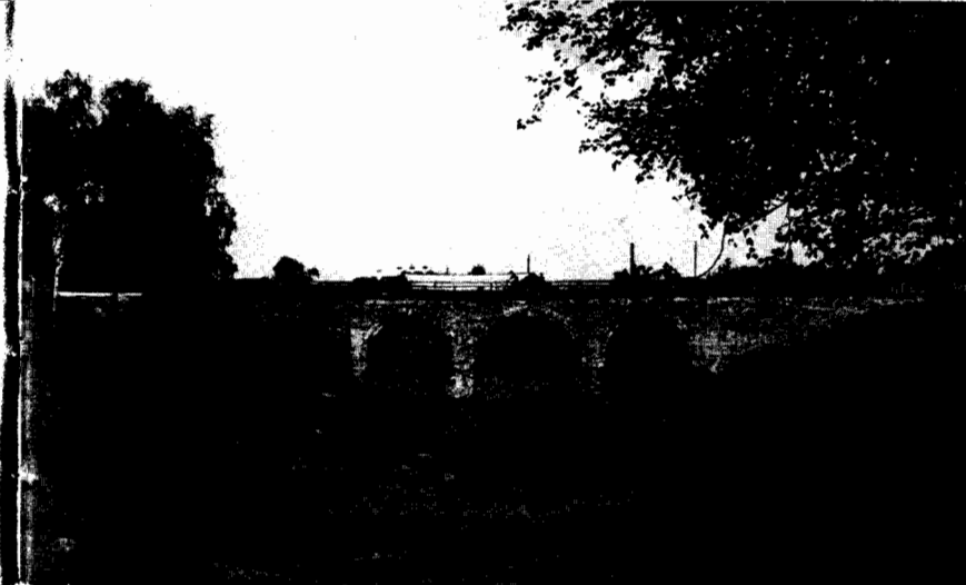
116. Мост через ров. XVIII в.

Деревянный город не сохранился. Он сильно обветшал к концу XVII века и был разобран. Однако могучие валы, местами осыпавшиеся и расползшиеся, до сих пор производят весьма сильное впечатление, напоминая о былом