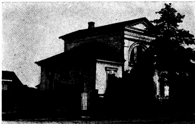
121. Особняк. Середина XIX в.

Однако в своем настоящем виде она производит весьма сильное впечатление. Построенная из того же материала, что и стоящие рядом обычные, на высоком подклете северные избы, она, возвышаясь над ними, как бы воскрешает обстановку далекого прошлого, когда селившиеся в этих местах первые переселенцы, в борьбе с природой отвоевывая новые земли, возводили дома и такие вот, не лишённые чувства прекрасного, приходские деревянные церкви.