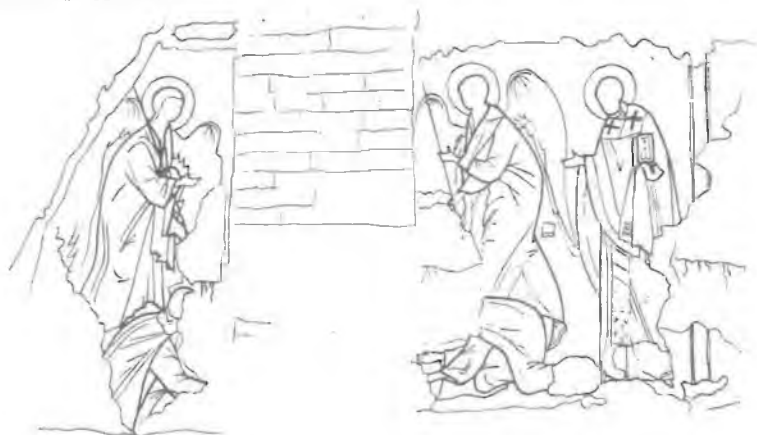
Фреска на южной стене собора Рождества Богородицы. 1502 г. Рис. В.Ф.Соколовой

Нельзя не сказать в связи с атрибуцией раки о роли фрески 1502 г., украсившей захоронение Мартина задолго до ее устройства (именно поэтому рака и закрыла впоследствии нижнюю половину фрески).