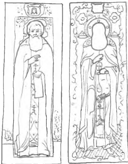
Икона Мартиниана XVI--XIX вв. и оклад 1859 г. Рис. В.Ф.Соколовой

Над оплечьем на окладе надпись: "Образ святого // пре Мартиниана", на свитке: "Не скорбите убо братия мои и не унывайте, аде угодна будут дела мои". На иконе же на свитке иной текст: "Предания и чин обители сея сохранити и ничтоже от чина мирскаго и устава, якоже видесте от нас, тако и творите Божия же" (такой же текст на свитке храмовой иконы в церкви).